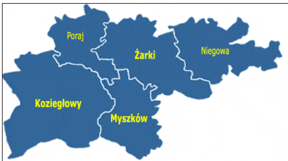
Rys. 1. Położenie Gminy i Miasta Kozięłowy na tle pozostałych gmin powiatu myszkowskiego

W skład Gminy i Miasta Kozięłowy wchodzi 29 miejscowości: Miasto Kozięłowy z dzielnicami Wylągi i Rosochacz oraz sołectwa - Brzeziny, Cynków, Gliniana Góra, Gniazdów, Koclin, Kozięłówki, Krusin, Lgota Górna, Lgota Mokresz, Lgota Nadwarcie, Markowice, Miłość, Mysłów, Mzyki, Nowa Kuźnica, Oczko, Osiek, Pińczyce, Postęp, Pustkowie Lgóckie, Rzeniszów, Rzeniszów-Łazy, Siedlec Duży, Siedlec Mały, Stara Huta, Winowno, Wojsławice i Zabijak.